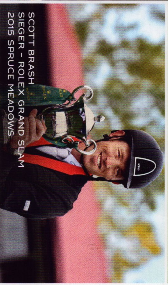
SCOTT BRASH SIEGER – ROLEX GRAND SLAM 2015 SPRUCE MEADOWS