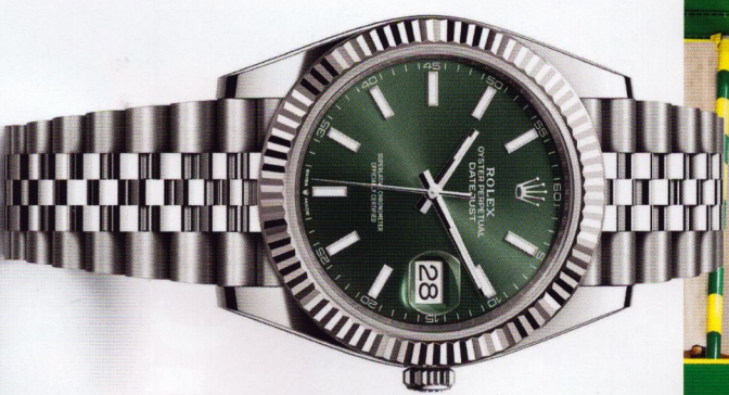
OYSTER PERPETUAL DATEJUST 41