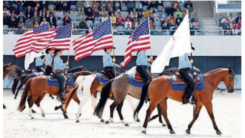
„Stars and Stripes“: Das Partnerland USA steht am Dienstagabend im Mittelpunkt der Eröffnungsfeier.

Nach der Begrüßung der teilnehmenden Nationen werden die US Color Guard & Caisson Platoon Soldiers auftreten. Doch natürlich werden die Pferderassen, für die die USA berühmt sind, nicht fehlen, wie die Quarterhorses oder auch die Mustangs. Auch das NRW-Landgestüt zollt bei seiner großen Quadrille unter dem Titel „NRW & USA - Friendship Quadrille“ dem Partnerland Anerkennung. Super-Bowl-Atmosphäre, Cheerleader gehören ebenso dazu wie eine berühmte Figur aus den USA: „Barbie“. Die Social-Media-