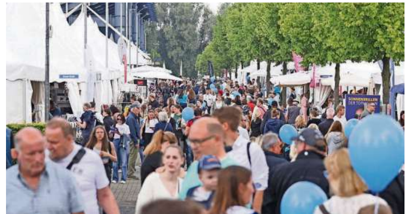
Viel Programm, viele Besucher: Der Soerser Sonntag 2024.