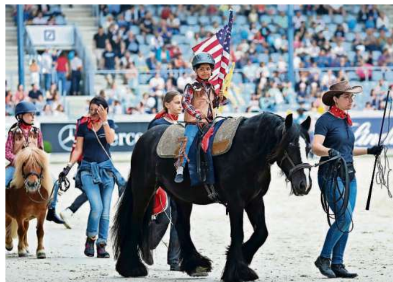
Auch die Kleinsten waren dabei.